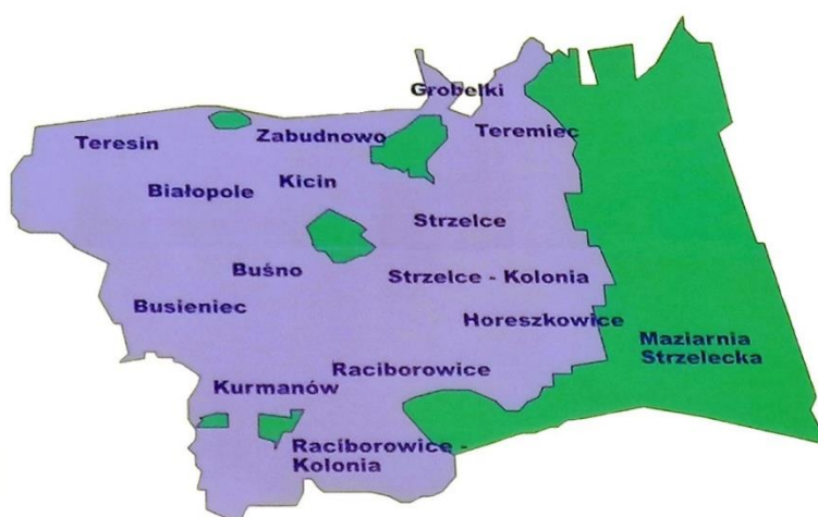
Rysunek 1 Mapa Sołectw Gminy Białopole

W skład Gminy Białopole wchodzi 14 sołectw: